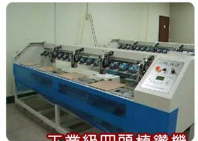
工業級四頭植鑽機