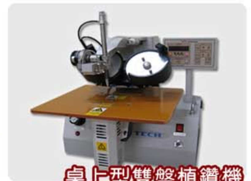
桌上型雙盤植鑽機

※Specifications and appearance are subject to change improvemert without prior notice.