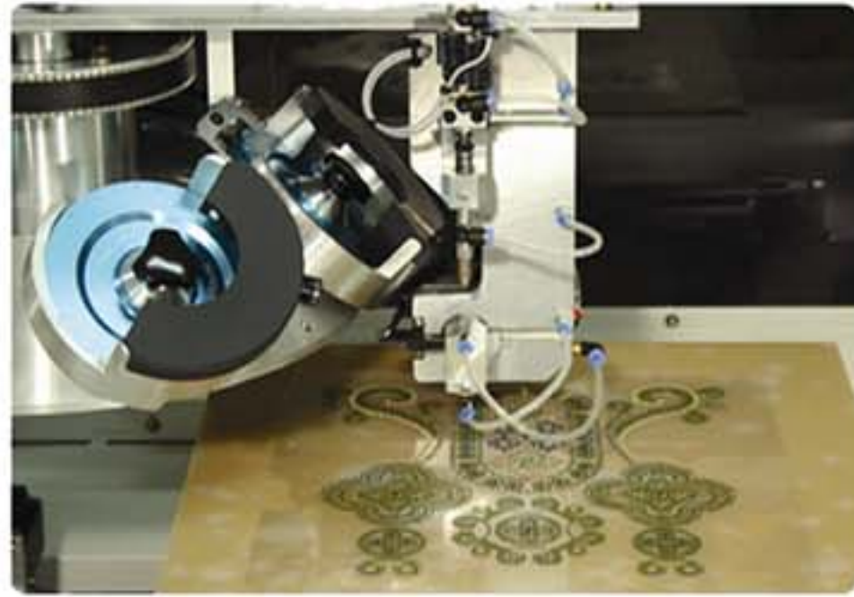
自動化排鑽。精密定位免人工 彩鑽多元變化可供六種樣式設計