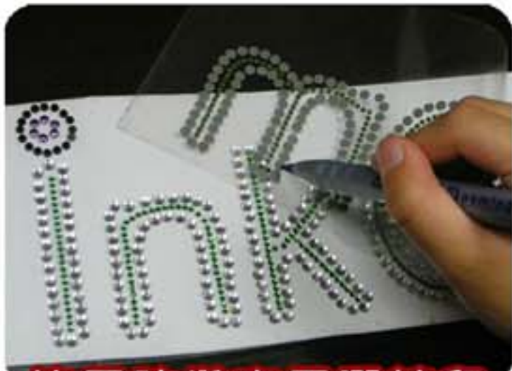
使用貼鑽專用膠轉印