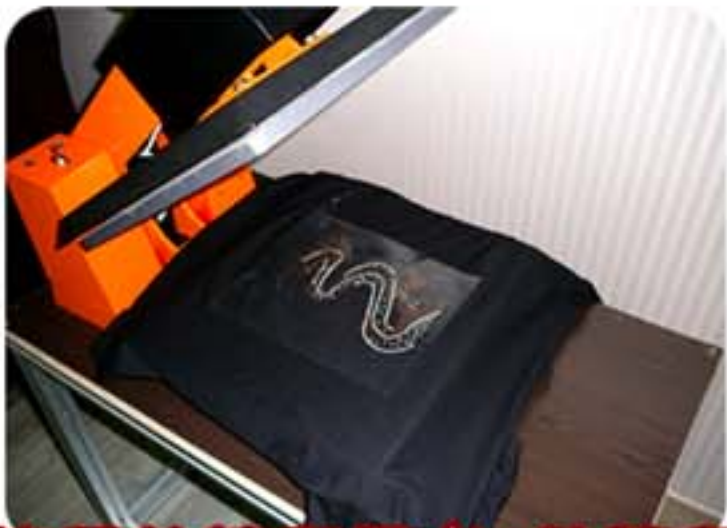
使用熱轉印機/加熱轉印