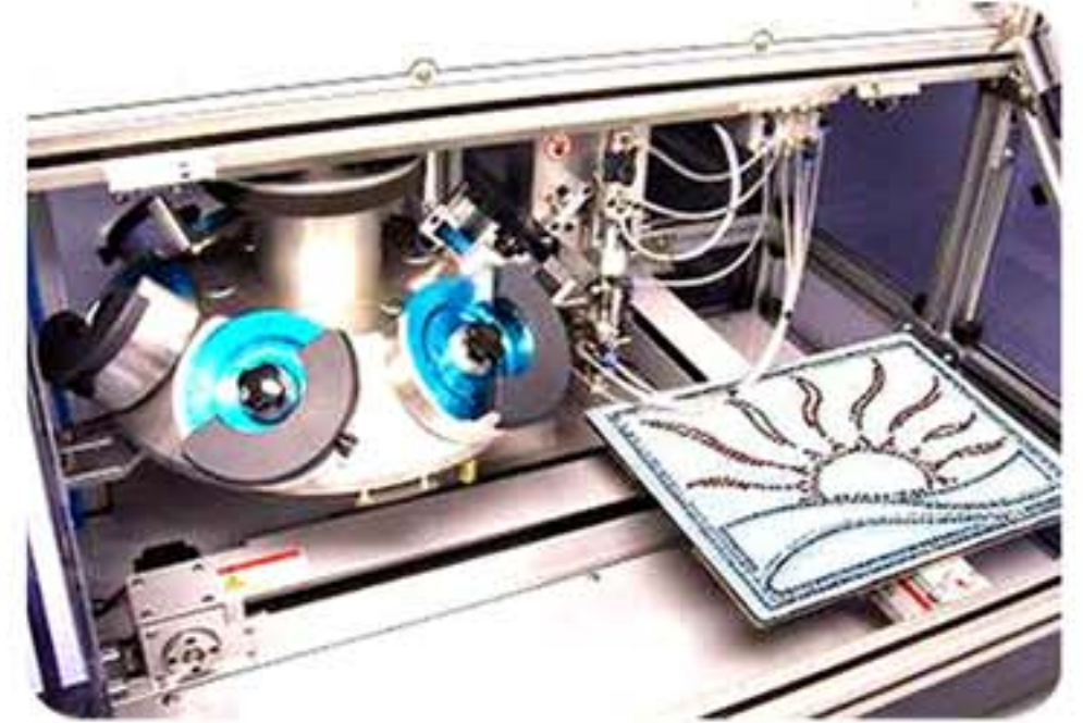
數位化設計圖檔。可重複輸出 少量多樣化。免開版