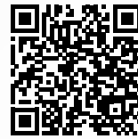
新一代工業白色噴頭